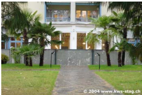
Protezione del bene immobile