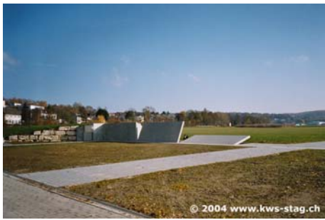
Protezione della serie del fiume